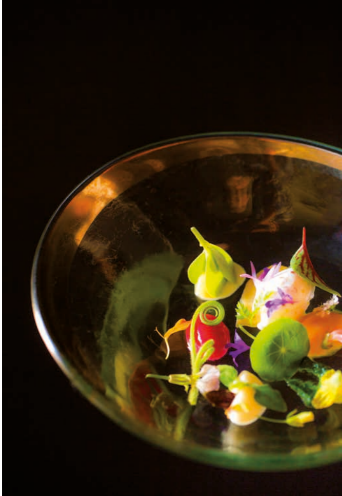
Vellutata di giardino con crema di mostarda

Se consideriamo che la cultura gastronomica americana spazia ovunque, ma è sempre indietro, di venti o duecento anni, rispetto all'Europa occidentale o al Giappone, è alquanto incredibile che Kinch sia stato invece sempre al passo con le ultime tendenze, se non addirittura un passo avanti. Tra gli chef americani contemporanei, la straordinarietà di Kinch si deve a due motivi principali: la sua maturità e la sua profonda conoscenza, quasi ossessiva, del cibo migliore al mondo. Benché non cucini o parli giapponese, di tutti gli chef occidentali non operanti in Giappone, David è forse quello che meglio ne conosce la cucina. Di un'alga kombu sa riconoscere una rishiri da una rausu . A questo punto della vita, poco gli interessa cercare espedienti o tentare imitazioni. Kinch è il maestro zen della cucina californiana contemporanea.