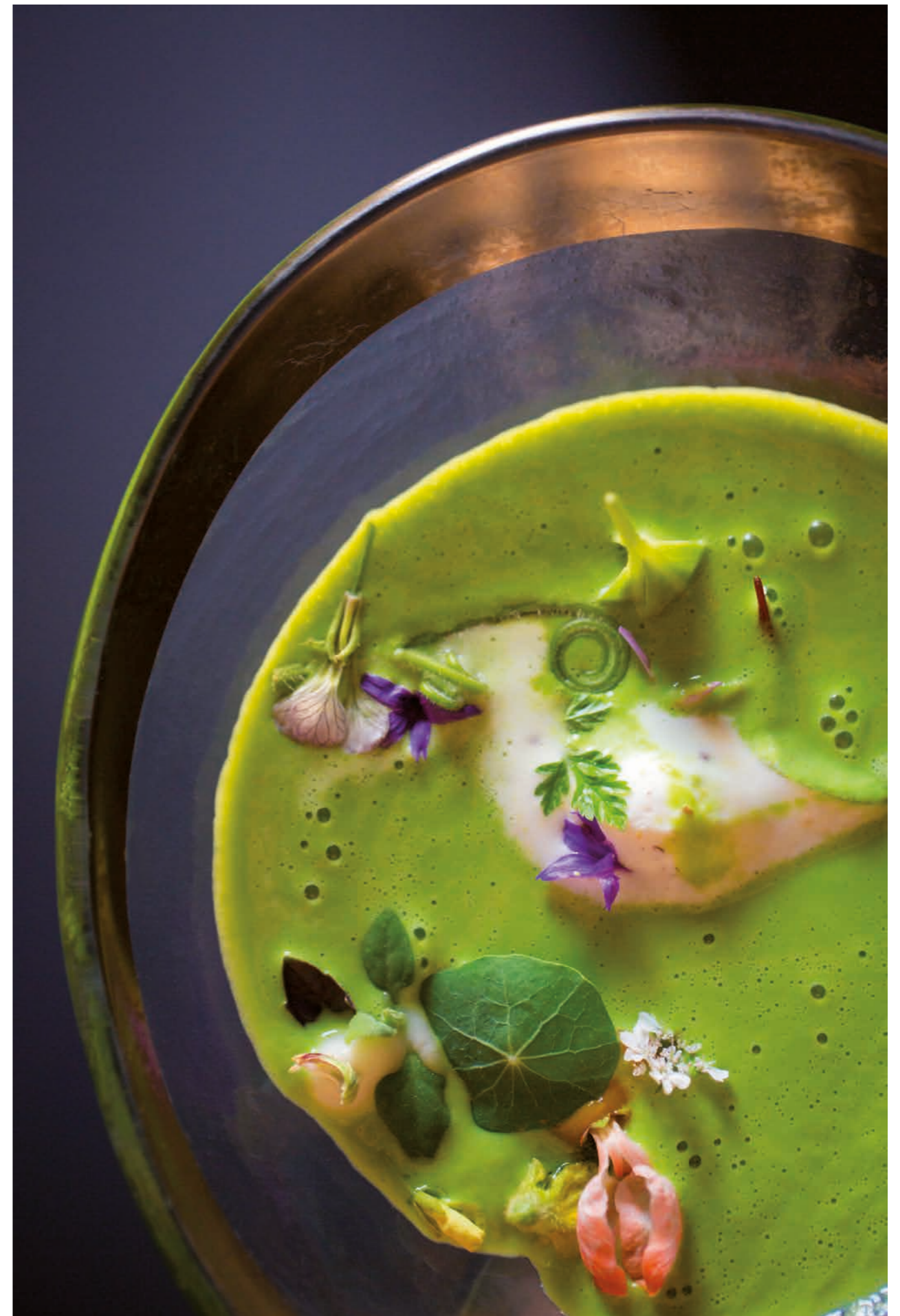
Il piatto finito

Una volta ha cucinato per Bernard Loiseau e ricorda Loiseau cucinare per i turisti che facevano un volo in mongolfiera. Nel 1988, Kinch si innamorava del Giappone, mentre era per cinque mesi a Fukuoka per lavoro. È un luogo dove ritorna sempre con piacere, di persona o con lo spirito.