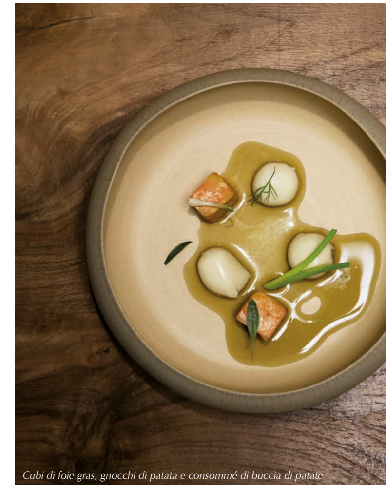
Cubi di foie gras, gnocchi di patata e consommé di buccia di patate