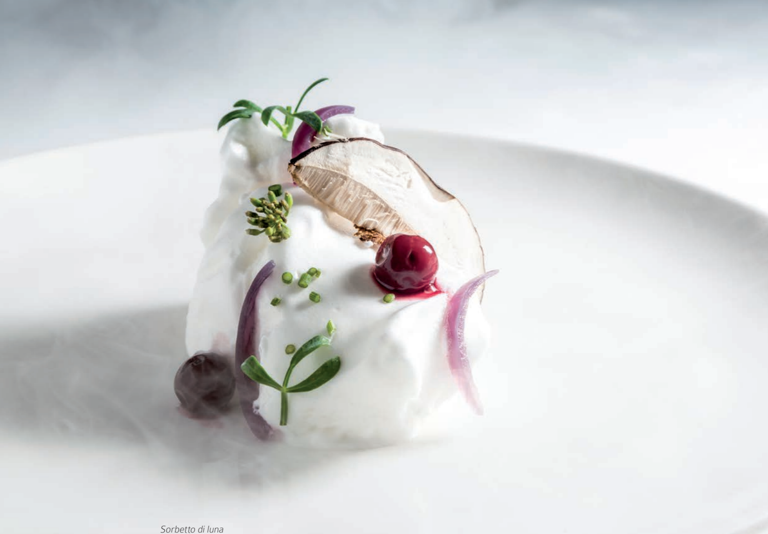
Sorbetto di luna