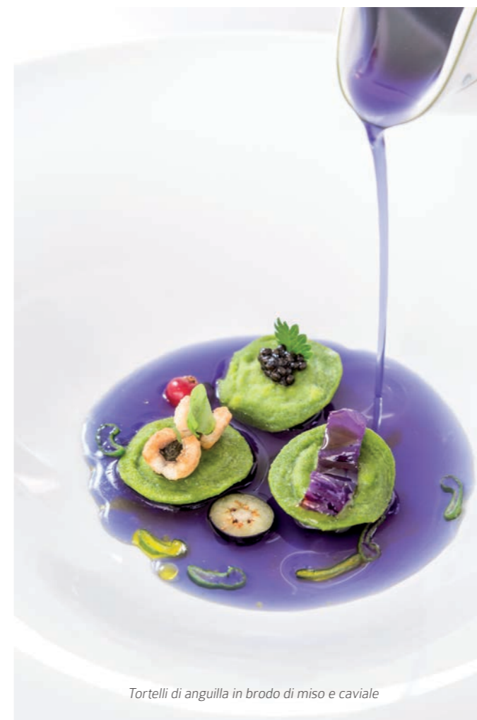
Tortelli di anguilla in brodo di miso e caviale