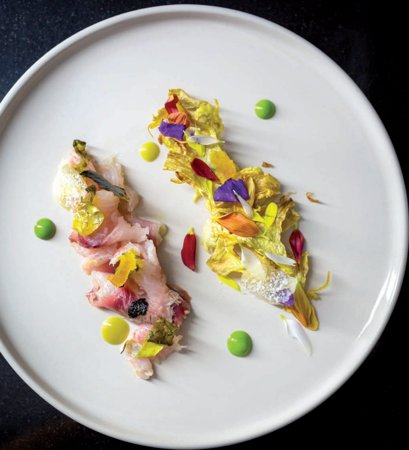
Muggine nell'Oasi di Burano