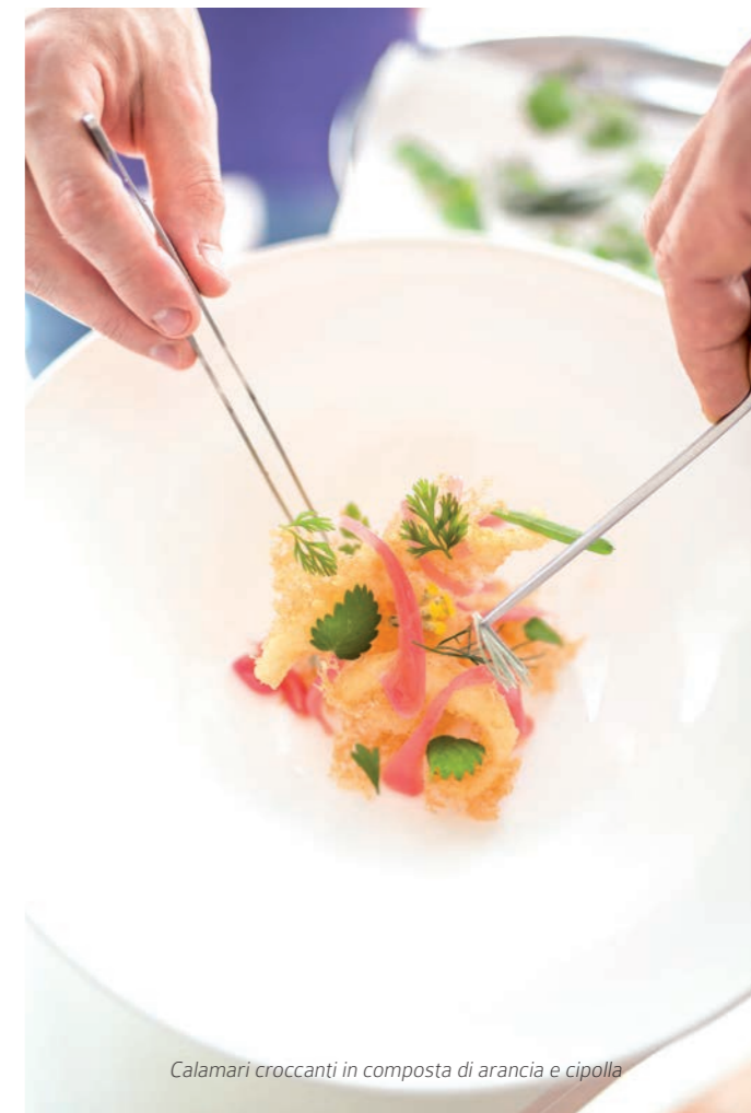
Calamari croccanti in composta di arancia e cipolla