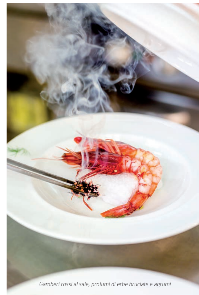
Gamberi rossi al sale, profumi di erbe bruciate e agrumi