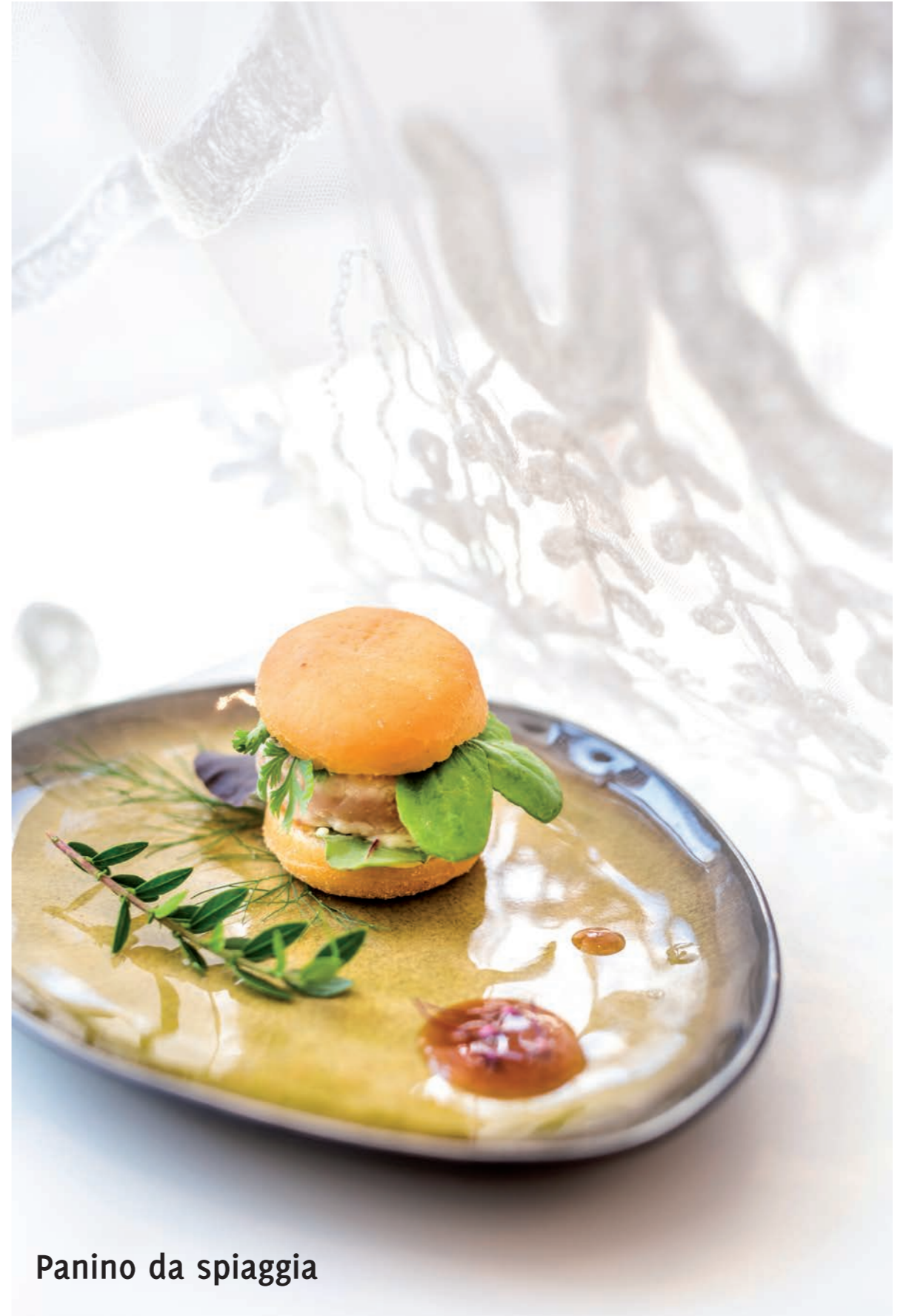
Panino da spiaggia

Viale Traiano 85 00054 Fiumicino (RM) - Italia Tel: +39 06 65 02 92 04 www.pascuccialporticciolo.com