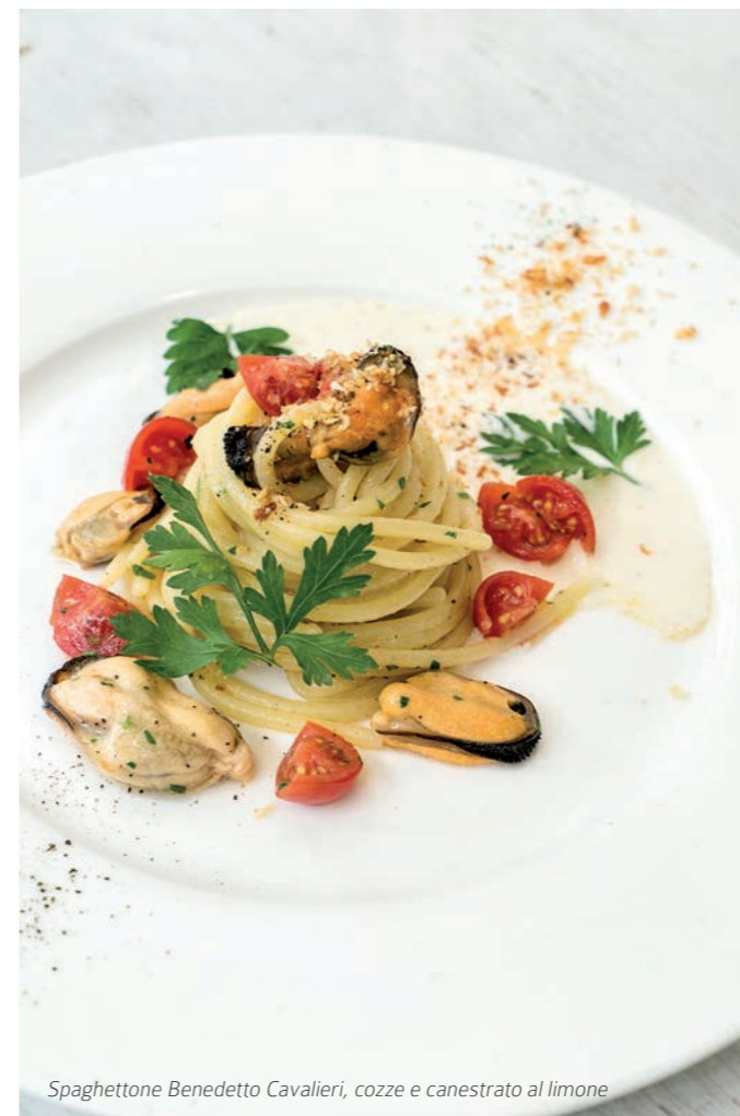
Spaghettoni Benedetto Cavalieri, cozze e canestrato al limone