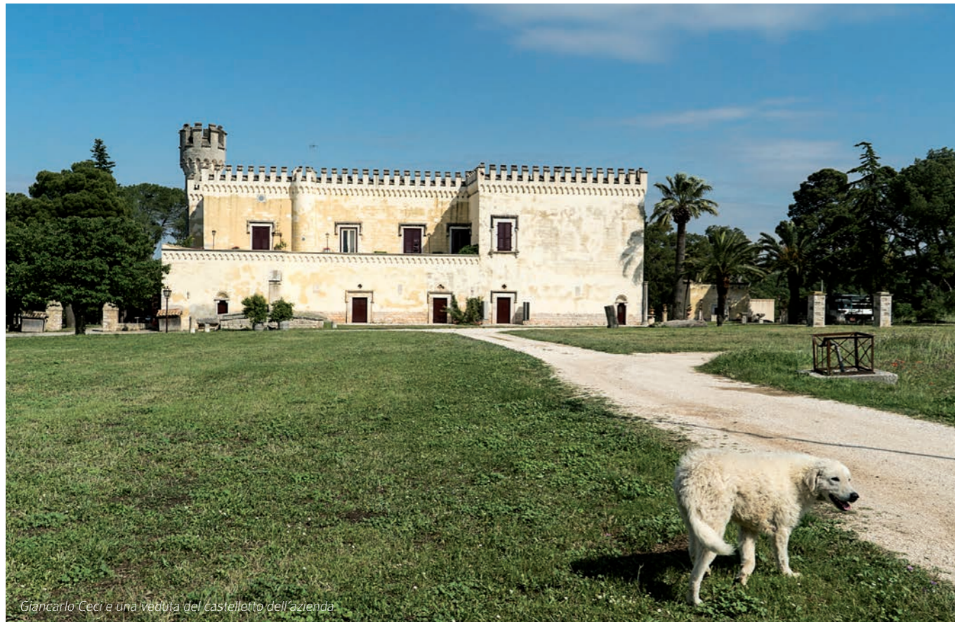
Giancarlo Ceci e una vedova del castelletto dell'azienda