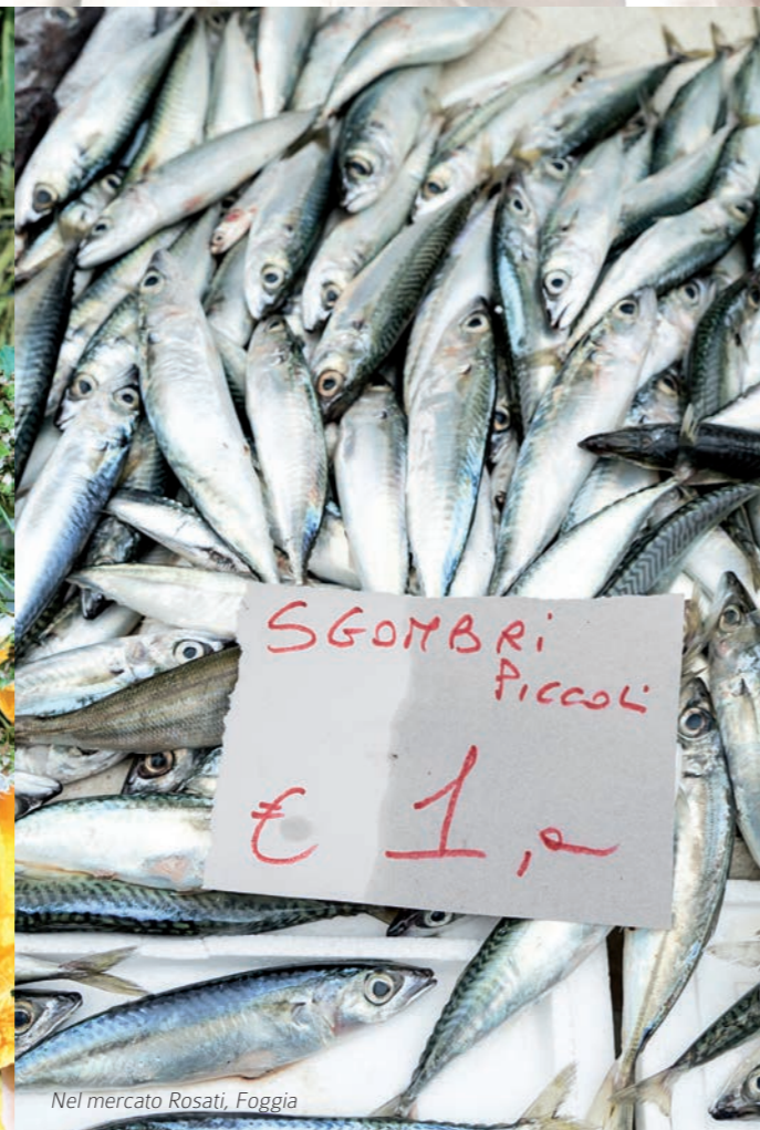
Nel mercato Rosati, Foggia

tico e campagna. Poi la Sarda e la "cordina dei morti", un'altra erba spontanea, un bel ritmo: sapido, poi amaro, poi il grasso, il ragazzo ci sa fare, se non fosse per qualche ingenuità e ambizione moderna, un grandissimo oste, nel senso più nobile e intenso. L'Italia non è forse questo? Paesaggio e memoria nel piatto, con qualche concessione al nuovo. Nicola è bravo, conosce la tradizione, ha qualche guizzo istrionico coltivato da curiosità gastronomica e conoscenza del prodotto, viene da una famiglia di macellai e dà del tu ai prodotti, come solo chi ci è nato in mezzo e cresciuto. I Troccoli al pomodoro sono buonissimi, sanno di feste di paese, profumano di paesaggio e ambizione, la pasta tirata a mano ha nerbo rustico, il sugo sa di casa e di domeniche mattina, una meraviglia... Boccone dopo boccone canticchio un pezzo di Randy Newman, apparentemente facile e giocoso, in realtà colto ed elegante. Il tempo di un morso a un pezzo di carne che ci ricorda le origini di Nicola, saporito e cotto alla perfezione, e dobbiamo continuare questo viaggio al sud.