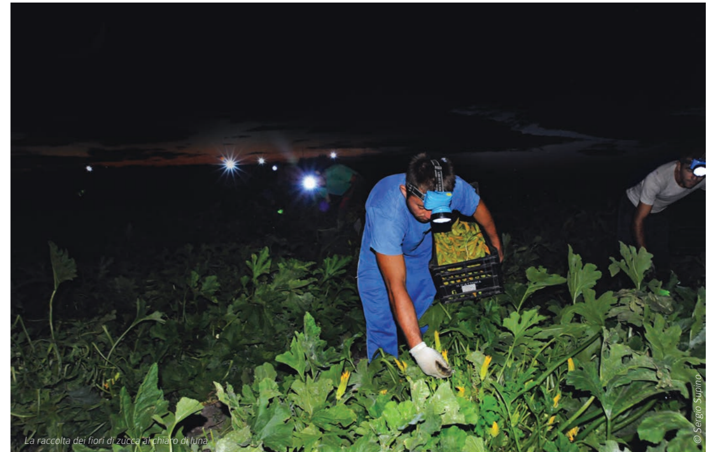
La raccolta dei fiori di zucca al chiaro di luna