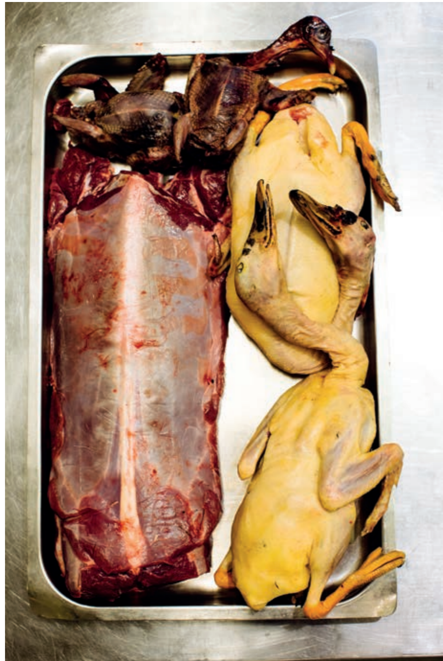
A fianco: A volte germano, a volte pernice, ma anche altro