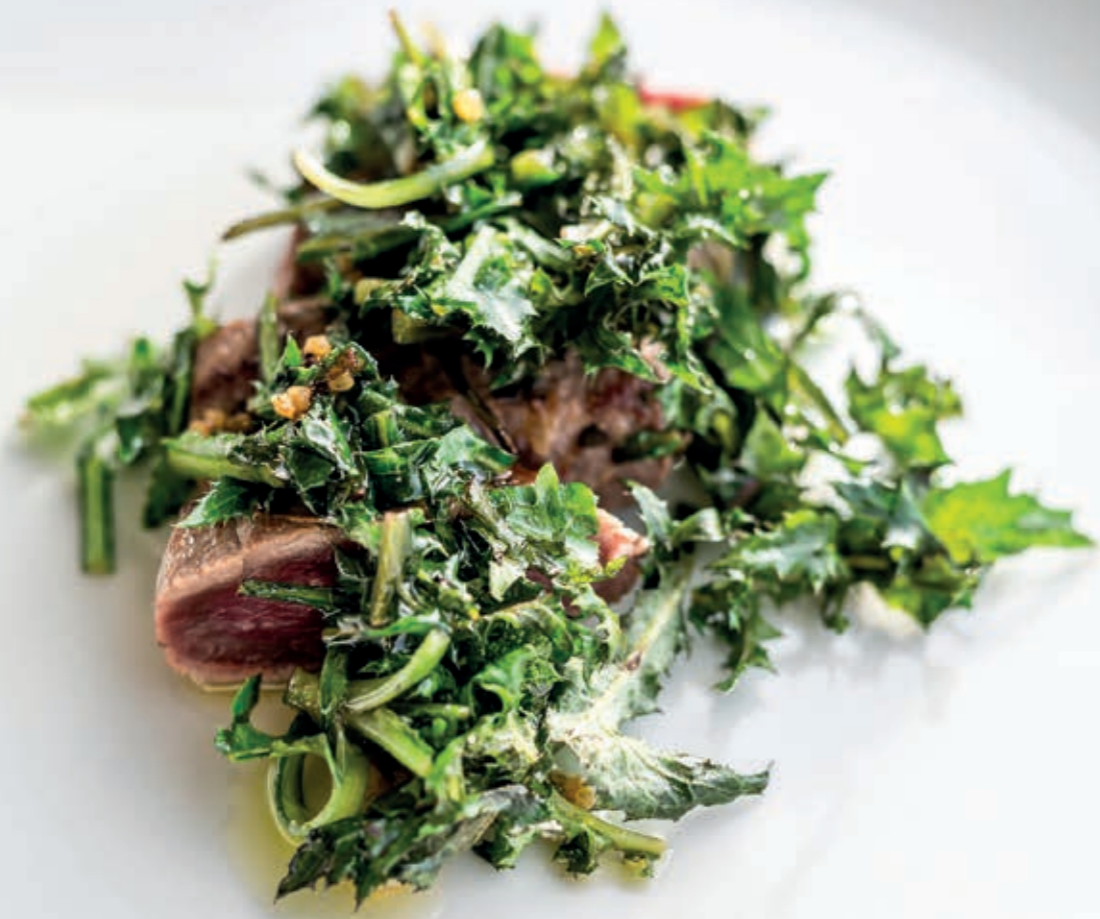
Montone, crispigni selvatici e frutti rossi