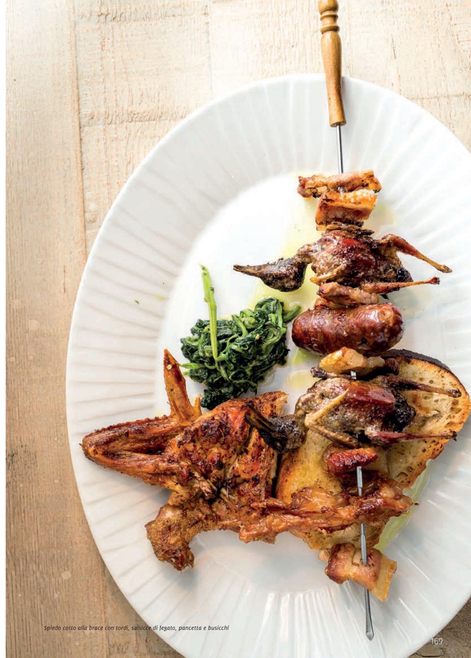
Spiedo cotto alla brace con tordi, salsicce di fegato, pancetta e busicchi