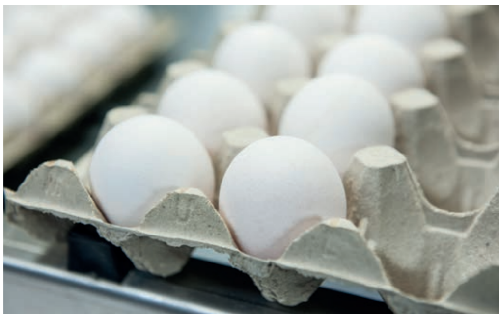
Sopra: Knekkebrød e uova bio Nella pagina a fianco: scallops al Mathall di Trondheim