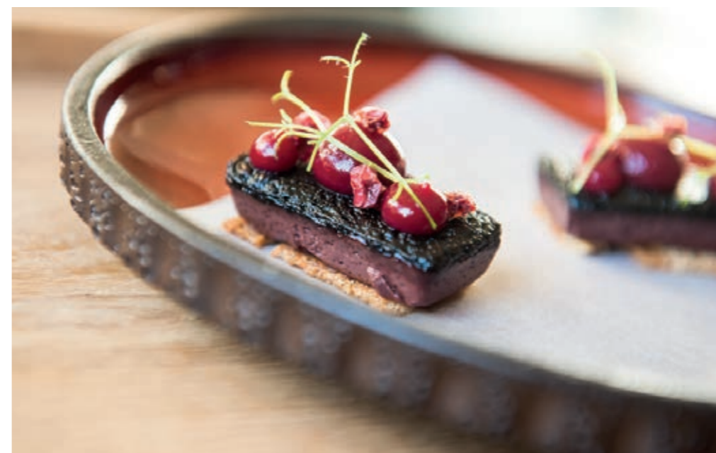
In alto: cavolo rapa con scampi, orzo fritto, salsa di cavolo rapa, siero e olio di aneto, neve di rafano e yogurt Sotto: toast di Black Pudding con mirtilli rossi