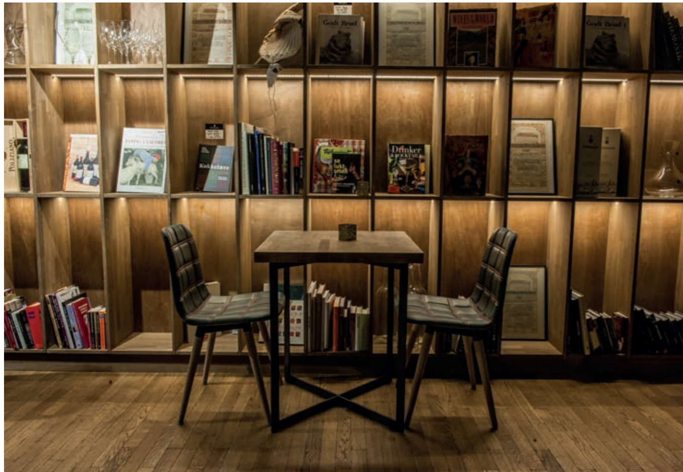
In alto: Nidarosdomen, la Cattedrale di Trondheim e l'interno del Food Hall (Mathallen)