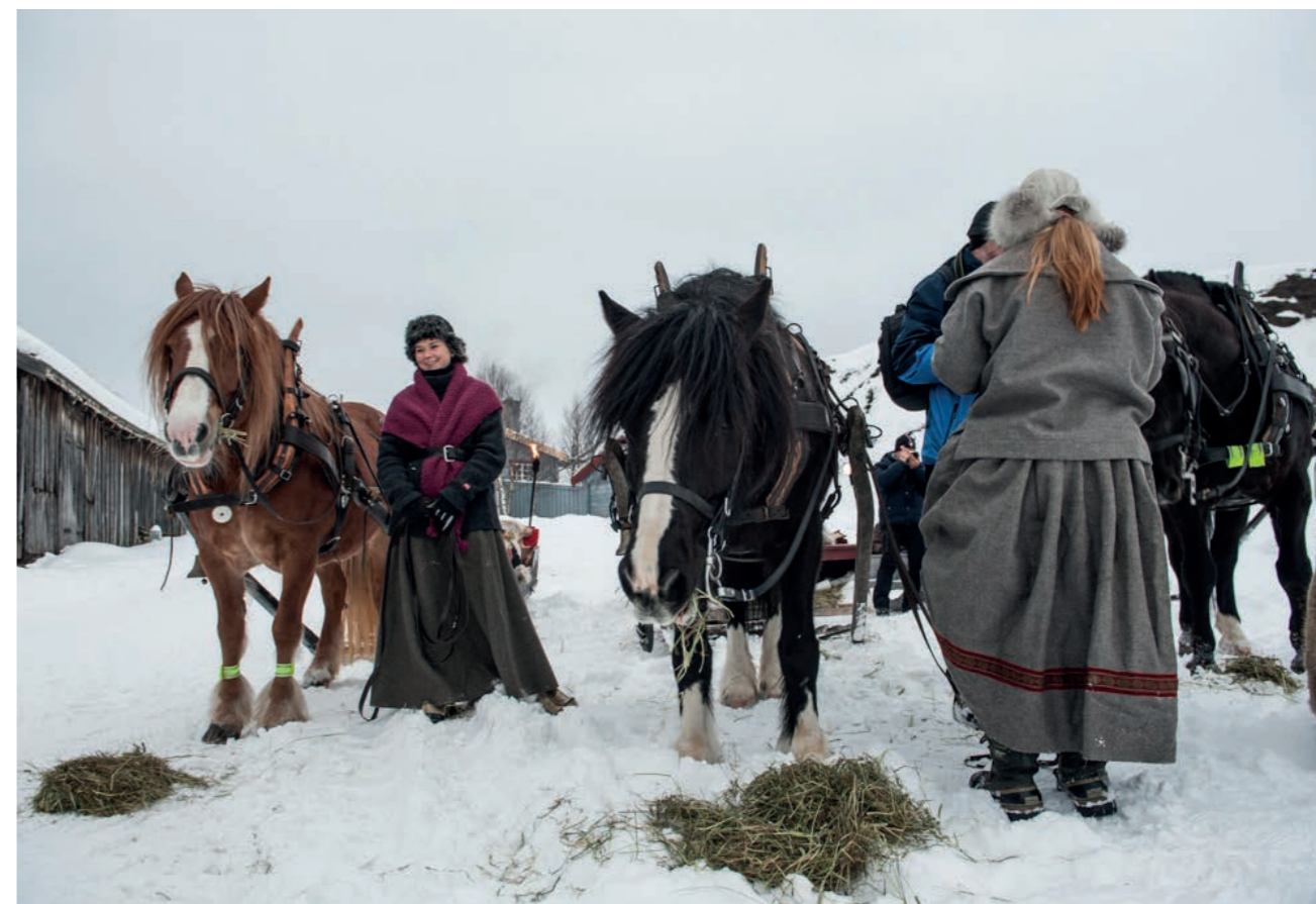
TESTO di GUALTIERO SPOTTI

Quella che negli ultimi anni viene generalmente definita Cucina Nordica, in realtà vive di molte sfaccettature che si possono osservare solo attraverso la frequentazione del territorio, scoprendo così le grandi differenze che esistono tra le diverse regioni scandinave, ancor più che tra le singole nazioni. D'altro canto non si può dimenticare che, tornando indietro negli anni, i confini tra i Paesi Scandinavi non erano esattamente quelli attuali: solo per fare un paio di esempi, la Norvegia per circa un secolo ha fatto parte del Regno di Danimarca, mentre la Finlandia per lungo tempo è stata parte integrante del Regno di Svezia prima di finire nella sfera d'influenza della Russia, nell'Ottocento.