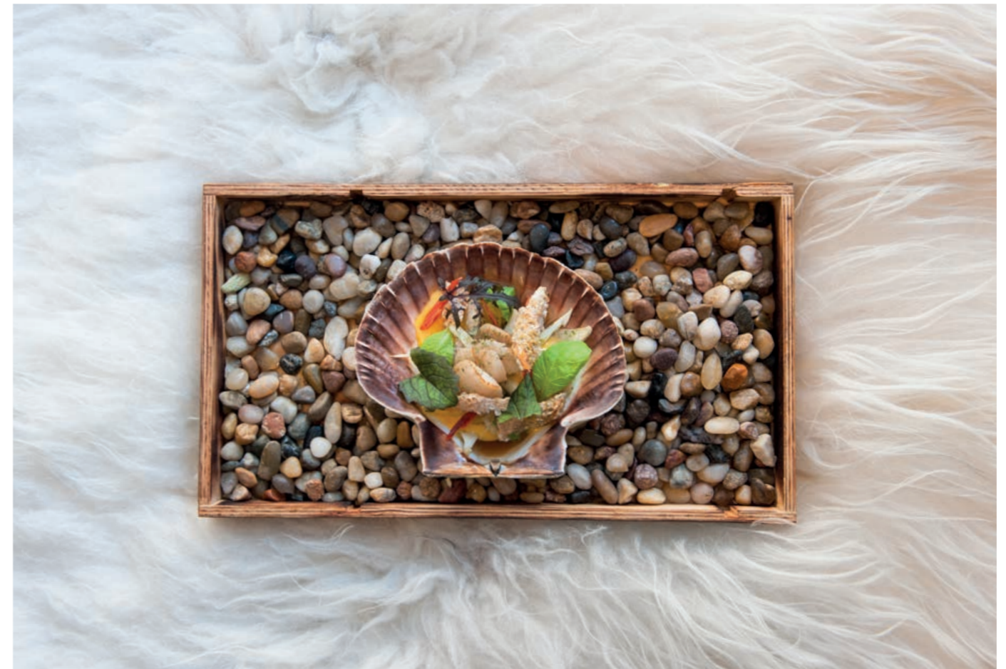
In alto: interno Folk og Fe A fianco: cuoco Stian Fjæreide, Folk og Fe Sotto: scorfano affumicato e capesante saltate, tuorlo d'uovo, finocchio, pelle del pesce croccante, brodo di capesante, erbe locali e aneto