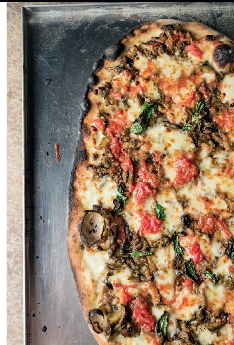
A fianco: Ca-Ramen di calamaro, ciliegie, zucchine, colatura e brodo umami di molluschi Pizza alla Parmigiana di Melanzane