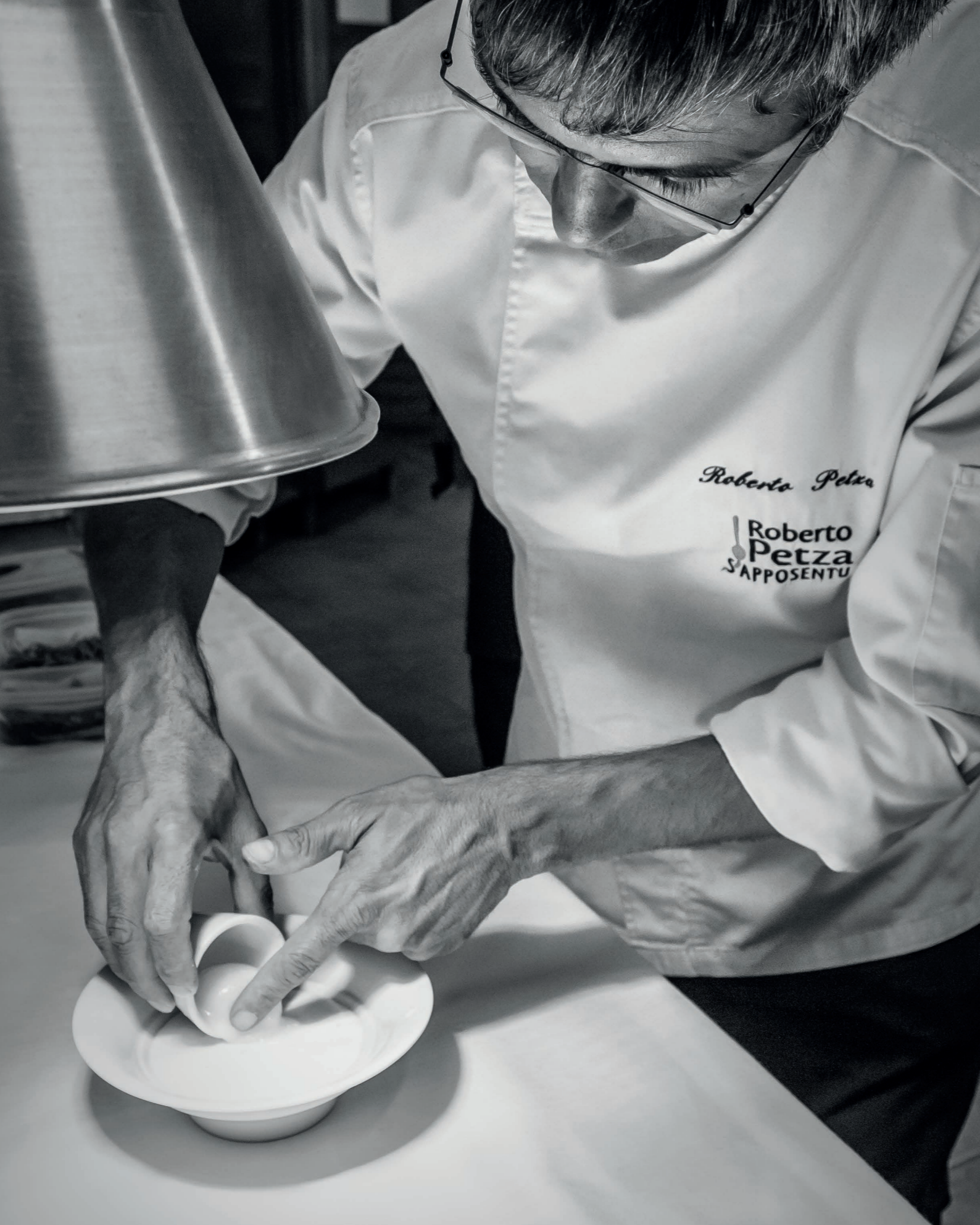
A destra: Zuppa di fregua di casa con le delizie del mare, basilico e profumo di agrumi Ricciola di fondale, zuppa di granchio, cozze e lattuga