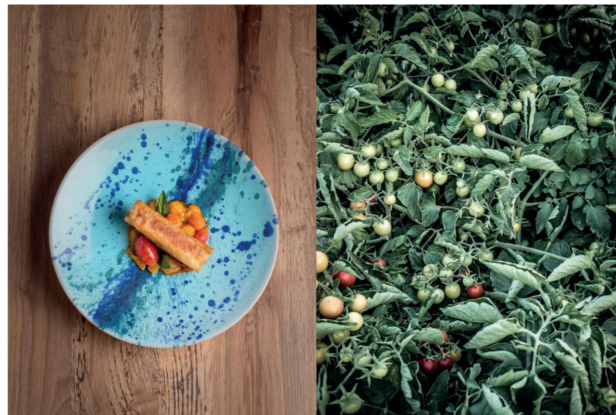
In alto: Triglia, pomodorini, cipolla in agrodolce e alkekengi

Via Cagliari, 3 09020 Siddi (VS) - Italia Tel: + 39 070 934 1045 www.sapposentu.it