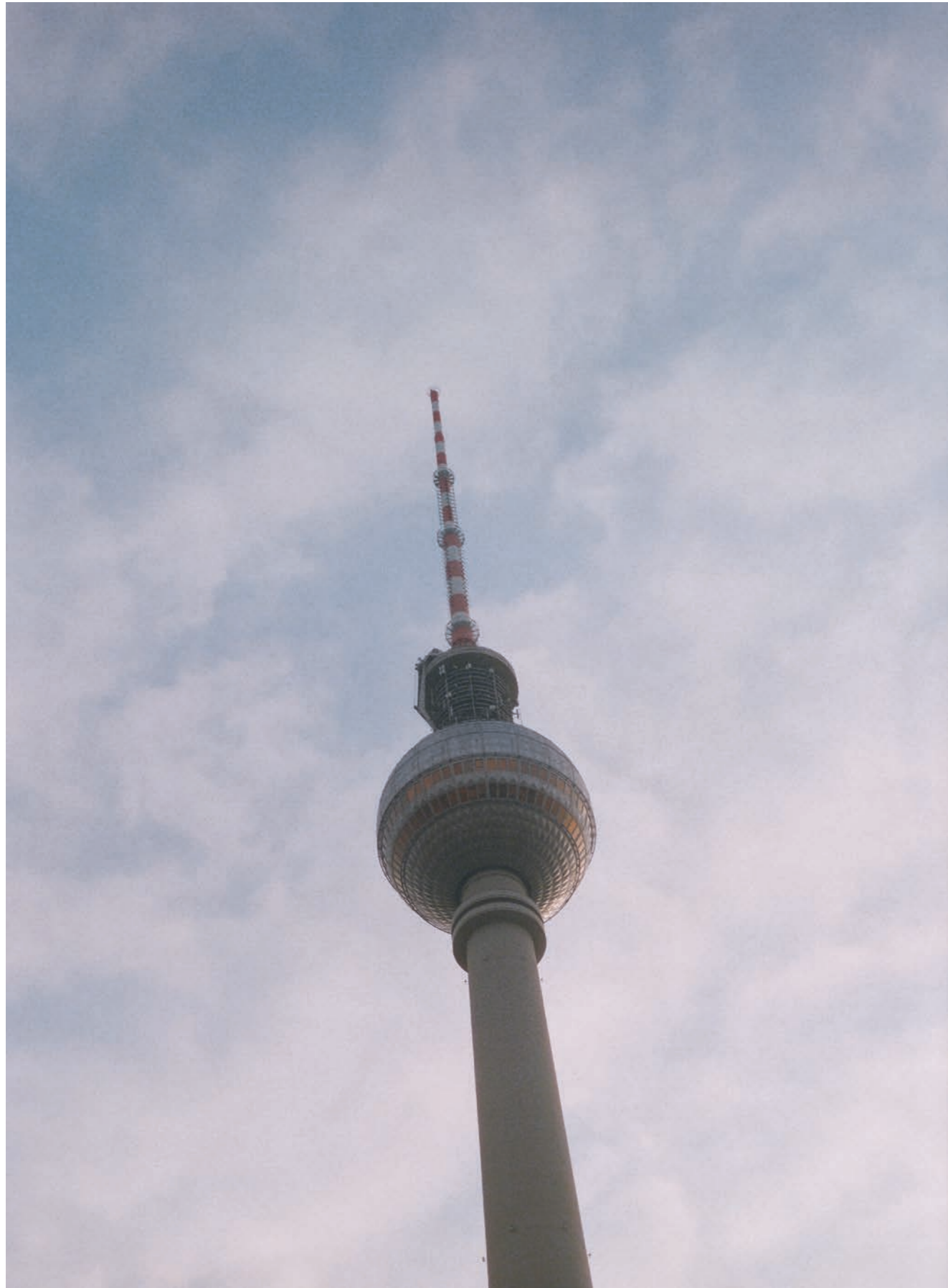
A fianco: Nobelhart & Schmutzig