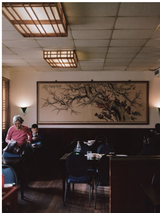
Ho Do Ri Koreanische Küche