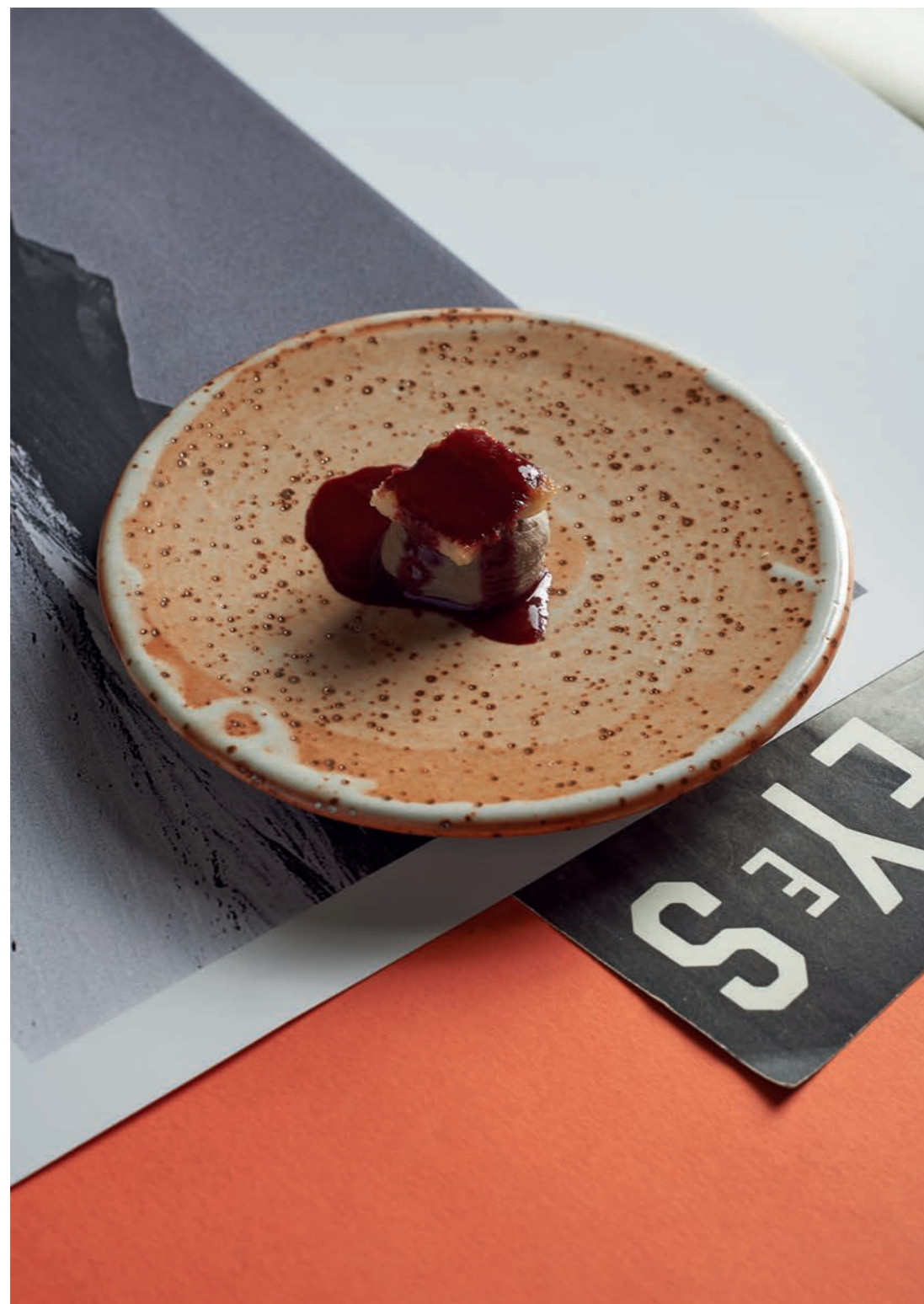
Sopra: Fegato di pollo, anguilla e melograno