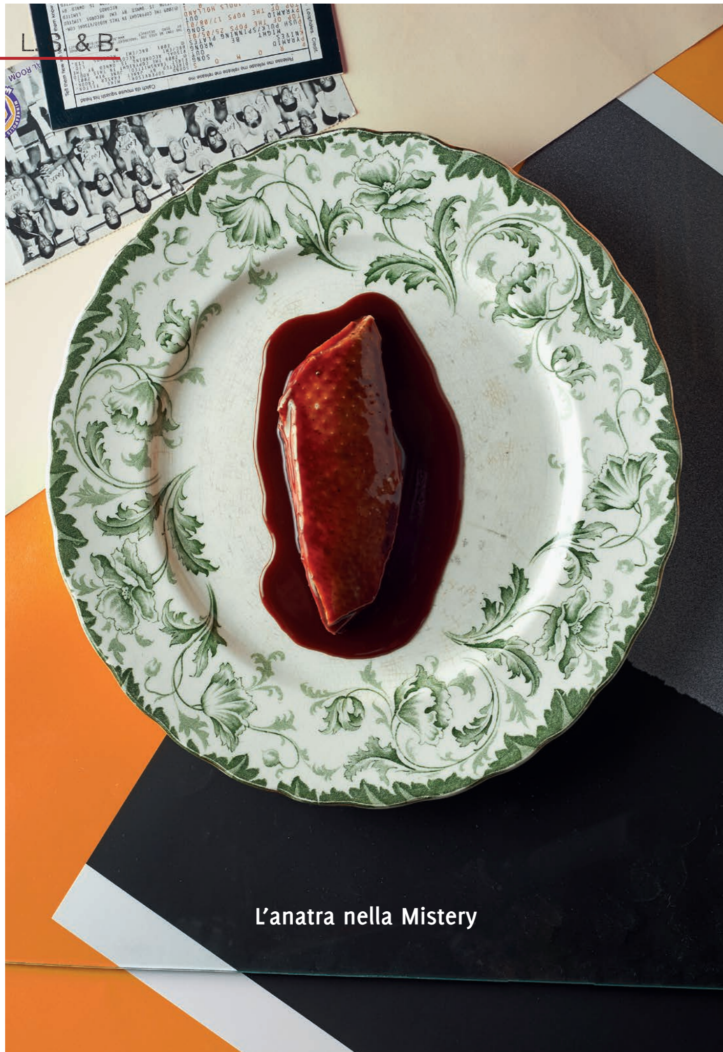
L'anatra nella Mistery