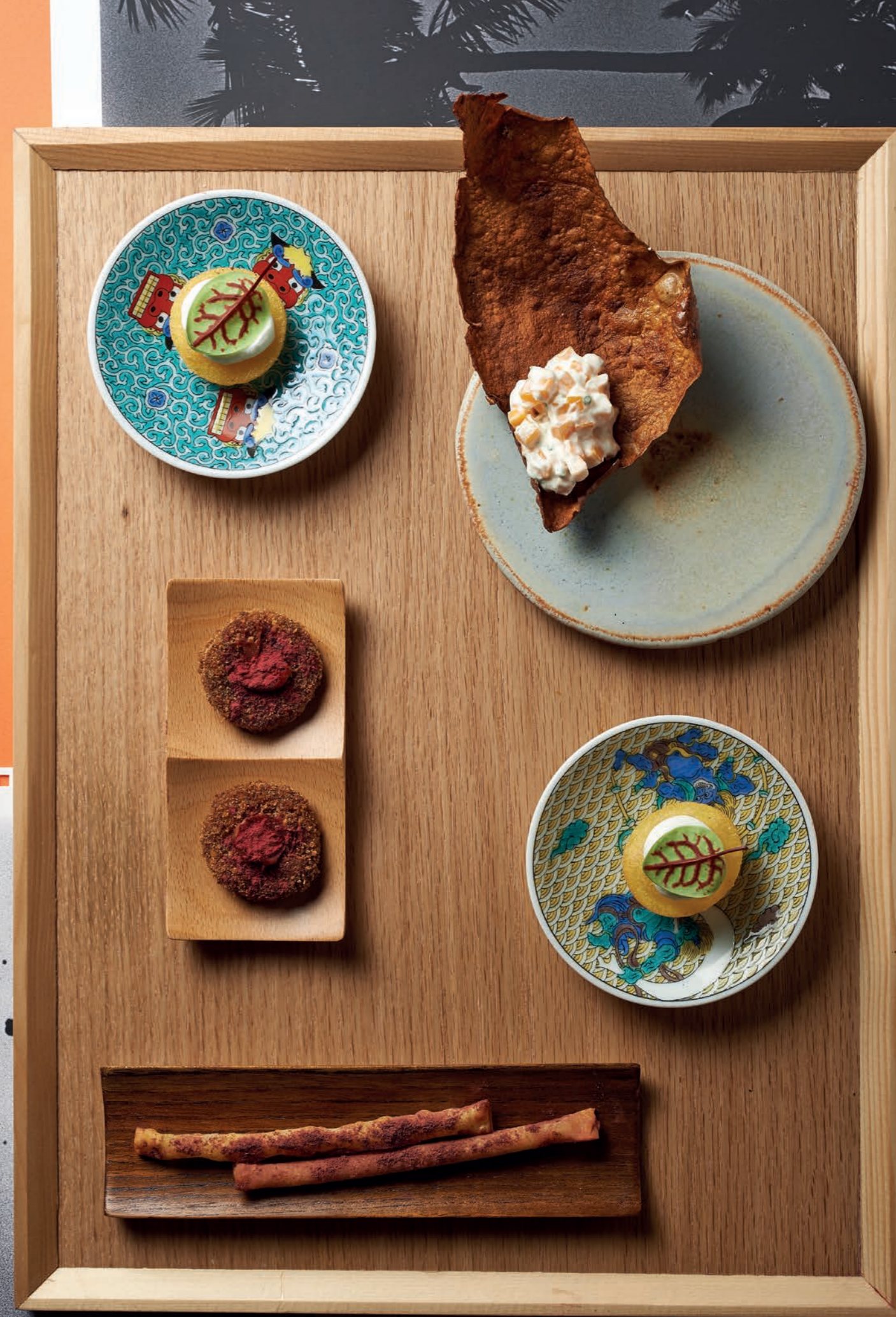
A fianco in senso orario: Arepa caprino e acetosa - Kartoffelsalat di patata americana - Cannolo pastinaca e ibisco - Orecchie di maiale e umeboshi