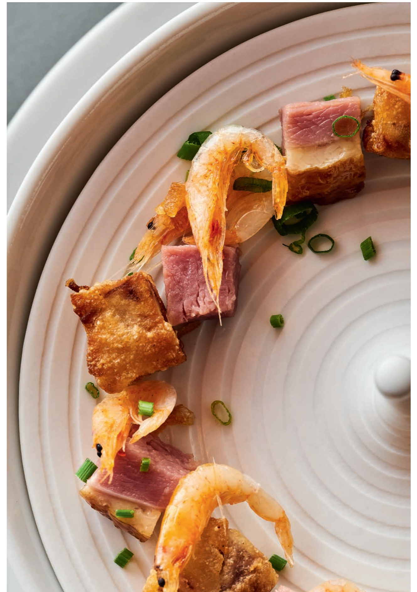
Dettaglio di 65°C Silkie egg: Uovo di gallina Moroseta a 65°C, Taro in Purè e Kueh, Yilan "Ya shang", gamberetti Sakura