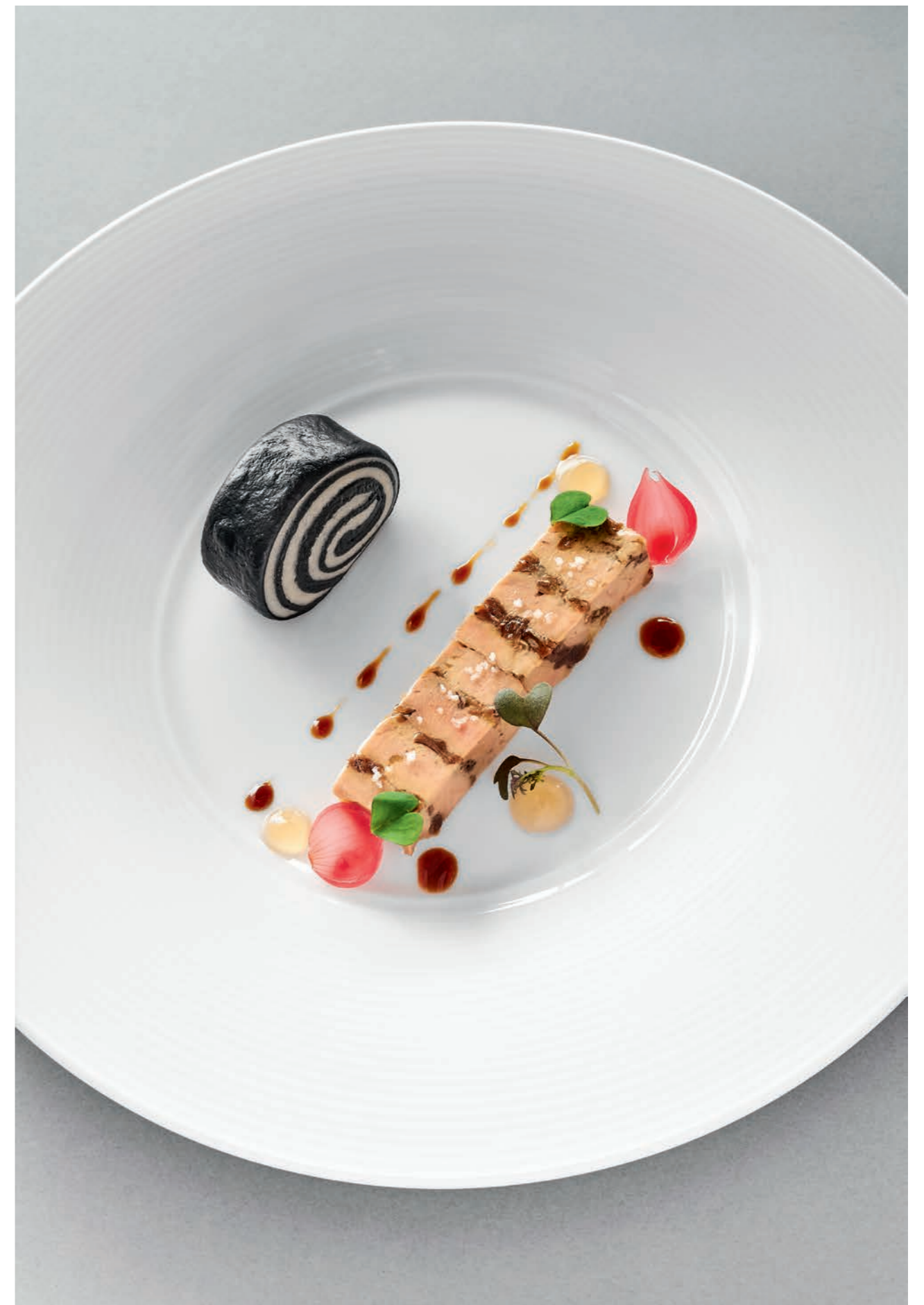
Foie gras, litchi secchi, kombucha, mantou al carbone