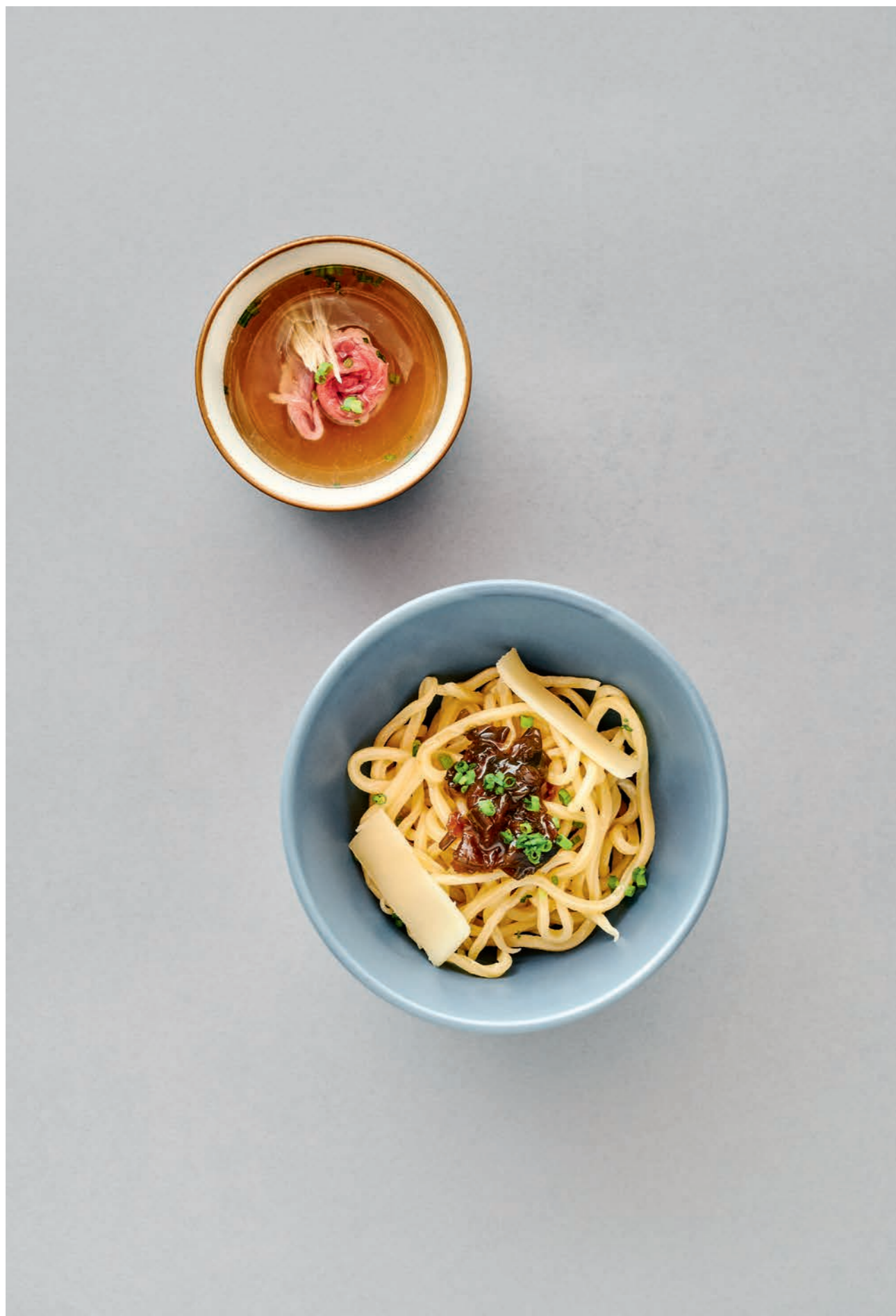
In alto: Beef noodles alle uova della casa, cipollotto bruciato, Comté e brodo di manzo crudo A fianco: Capasanta di Hokkaido, caviale Oscietra di Taiwan, pompelmo, aneto