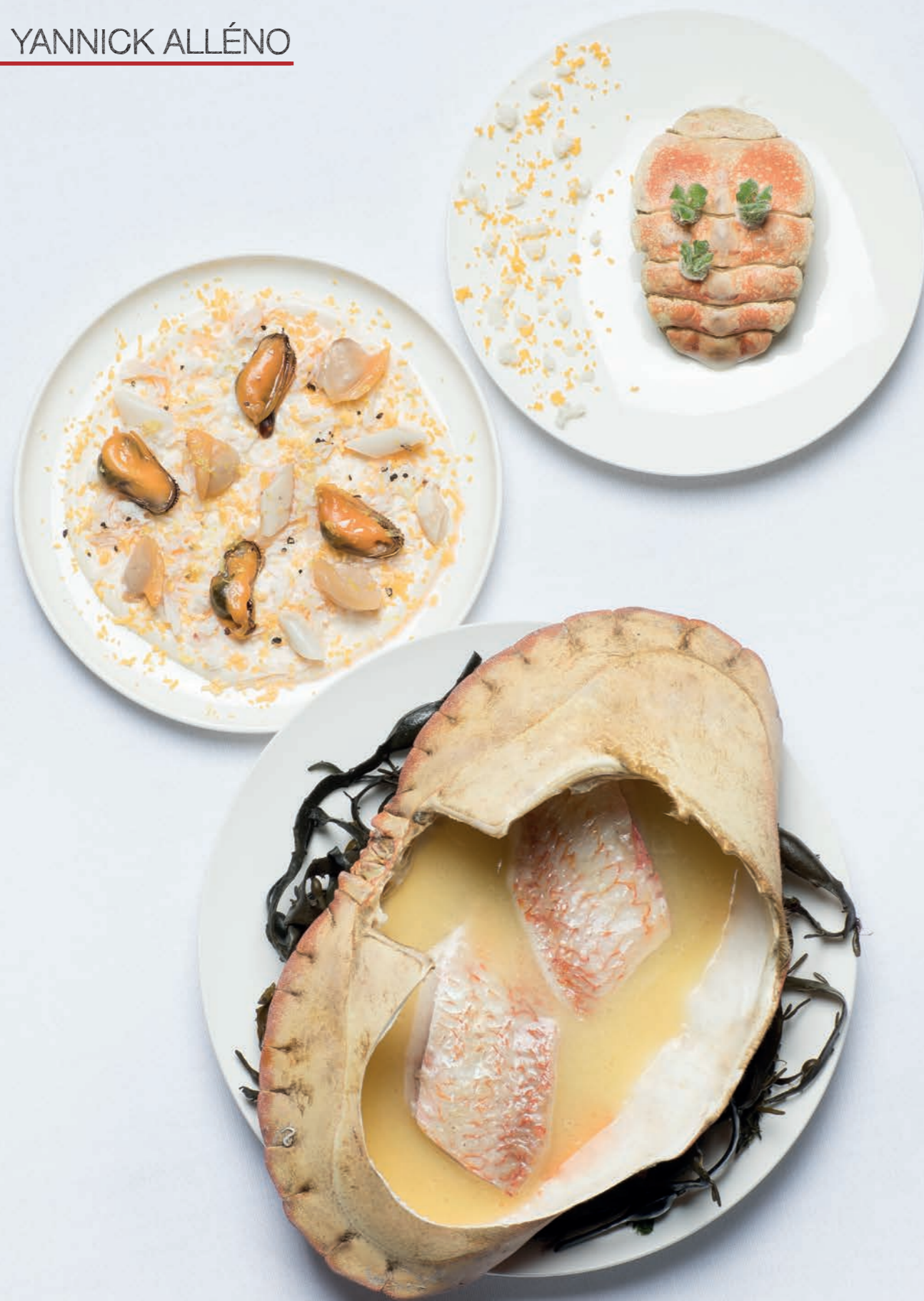
Triglia cotta nel guscio di granchio al brodo di conchiglie