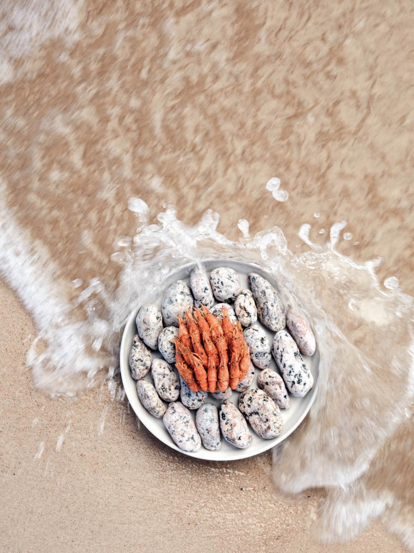
Gamberi del Baltico, rabarbaro, porcini essiccati