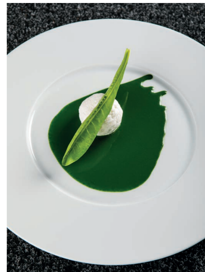
Sopra: Trippa di agnello A fianco: Gli appetizer Ossobuco alla Taglienti Cocco e clorofilla Acqua, olio, limone e liquirizia