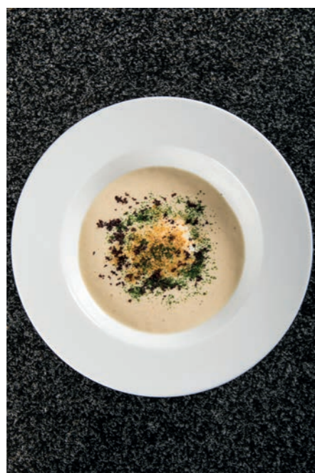
L'impiattamento della Burrida di stoccafisso