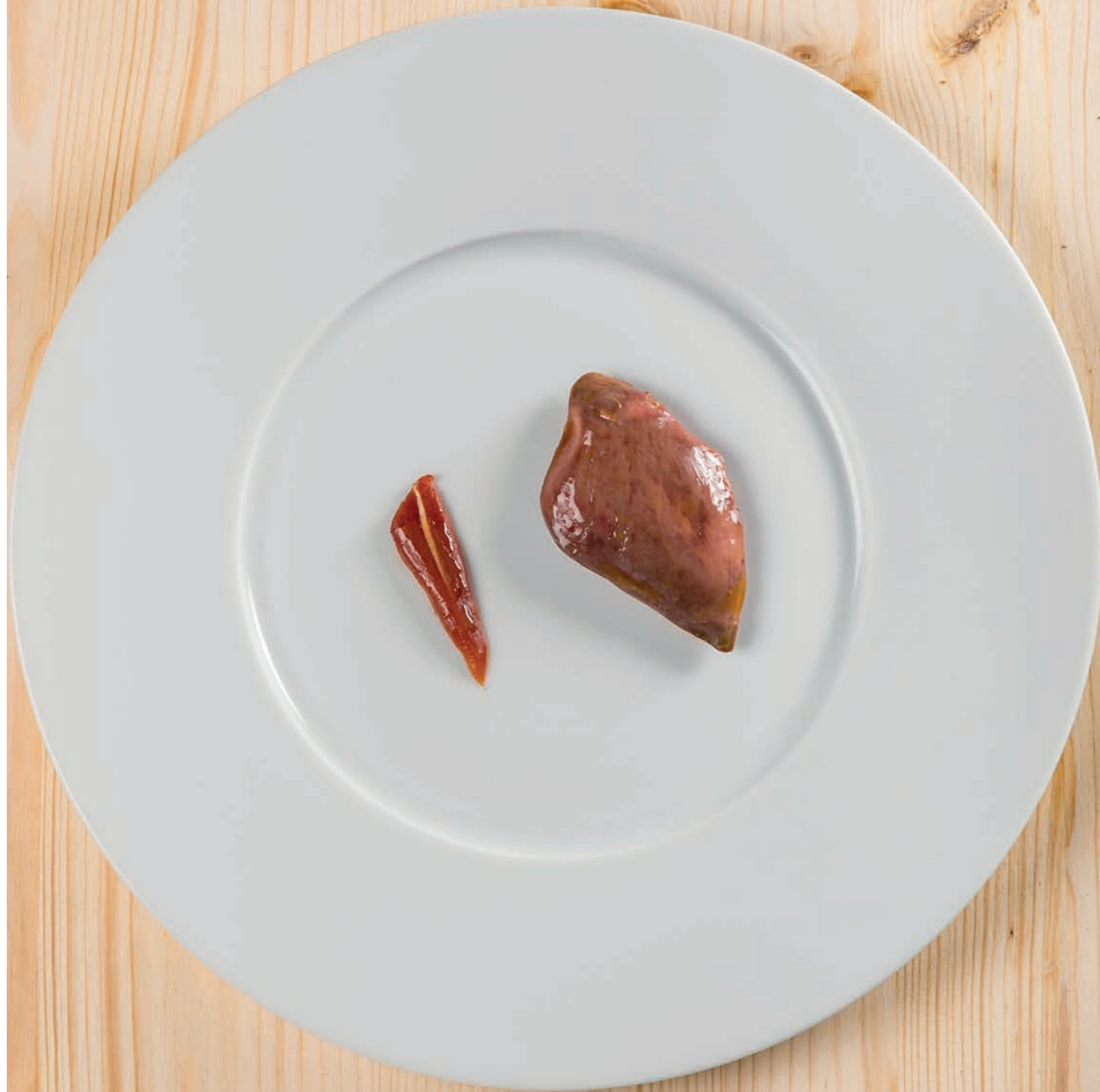
Piccione al tamarindo

Ciò che inizia con una scintilla... è destinato a diventare un'icona.